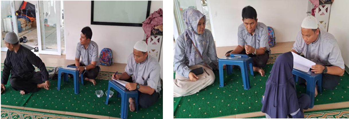
Gambar 3. Melatih Kemampuan Hafalan Surat Surat Pendek

Pada gambar 2 menunjukkan pelaksanaan hafalan surat surat pendek untuk usia dini untuk mengukur kemampuan dan pengetahuan siswa cara membaca Al-Quran sejak dini. Aktivitas belajar anak dengan bermain lomba tersebut memungkinkan anak belajar secara lebih rileks di samping menumbuhkan rasa tanggung jawab, persaingan sehat dengan sejawat, dan keterlibatan belajar secara tidak langsung memahami isi Al-Quran. Sama halnya dengan muadzin yang diukur adalah bagaimana adab, tajwid, lafadz, dan fashahah.