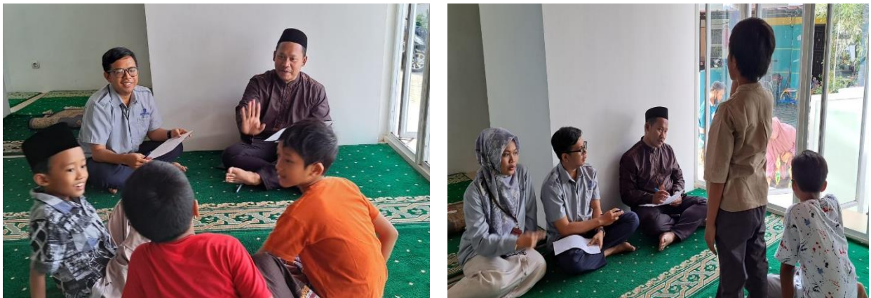
Gambar 2. Melatih Kemampuan Teknik Muadzin

Pada gambar 1 tersebut menunjukkan proses penyampaian dan penilaian dari kemampuan anak dalam mengumandangkan adzan. Pada pelaksanaan tersebut ditemukan bahwa beberapa peserta masih bervariasi kemampuannya dalam Teknik muadzin, kriteria kompetensi yang diukur adalah Adab adzan, Lafadz, Tajwid, dan Fashahah. Beberapa penjelasan yang perlu dipahami bahwa: