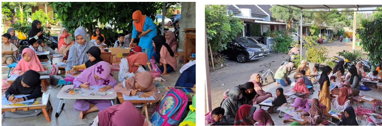
Gambar 4. Melatih Kemampuan Fokus dan Konsisten dalam Mewarnai Gambar

Selain kegiatan terkait dengan bagaimana kemampuan akan pemahaman ayat-ayat Al-Quran, terdapat juga kegiatan yang dilombakan yaitu mewarnai. Tujuannya adalah untuk melatih dan menilai pengetahuan dan kemampuan anak dalam mengerjakan sesuatu dapat focus dan konsisten (Itsnnani Sya et al., 2021).