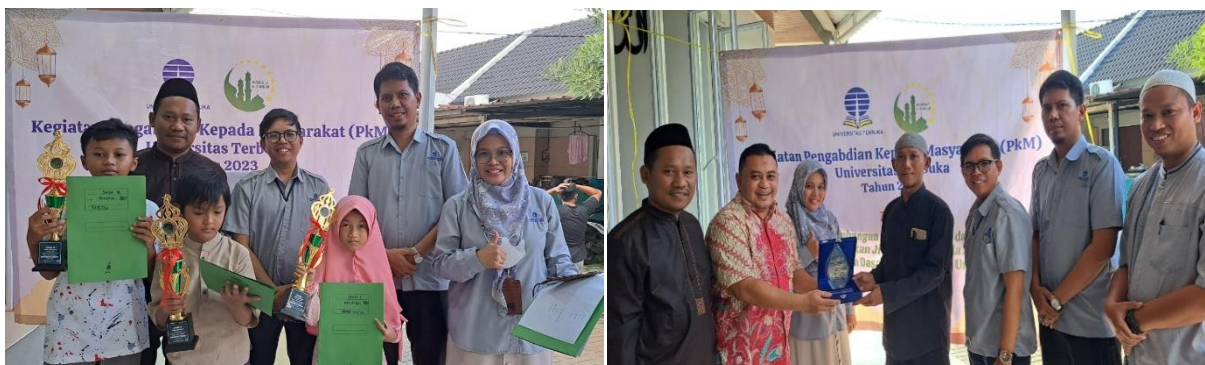
Gambar 5. Apresiasi Tim PkM kepada Mitra dan Peserta Literasi Islamiah

Pelaksanaan kegiatan pengabdian kepada masyarakat terkait melihat pengetahuan dan kemampuan anak usia dini dalam literasi islamiah yang dituangkan melalui sebuah perlombaan. Menilai sejauhmana kemampuan anak dari segi ingatan ayat-ayat Al-Quran yang telah dipelajari selama ini terkait bagaimana adab, tajwid, lafaz dan fasihnya. Selain itu bagaimana perilaku anak untuk melakukan sesuatu untuk focus, tanggungjawab, konsisten, kreatif yang diukur dari hasil kerja mewarnai, hal tersebut salah satu bentuk penerapan akan ajaran agama Islam. Oleh karena itu tim PkM dan mitra kerja memberikan apresiasi kepada para peserta yang sudah memperlihatkan kemampuan dihadapan para tim penilai. Apresiasi yang diberikan sebuah piala, sertifikat dan bingkisan untuk memotivasi para anak usia dini lebih mengolah dan terus melatih kemampuan dan meningkatkan pengetahuannya dengan banyak membaca dan memahami akan ajaran agama Islam. Selain apresiasi yang diberikan kepada para peserta, tim PkM juga memberikan plakat kepada mitra kerja dari Dewan Kemakmuran Mesjid (DKM) Al-Kamila karena telah banyak berpartisipasi dan kerjasamanya sehingga pelaksanaan kegiatan tersebut berjalan dengan baik dan sesuai dengan target.