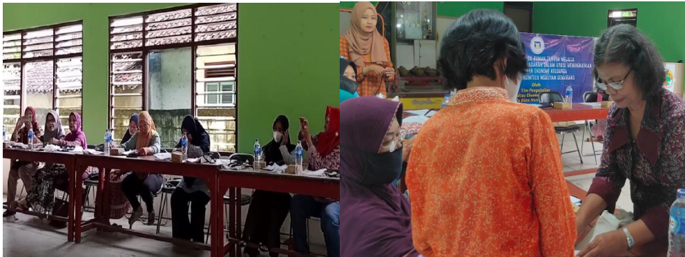
Gambar 4 Diskusi dan Tanya jawab

pendapatan dan pengeluaran dengan menggunakan contoh kasus yang disampaikan. Pada bagian ini peserta dapat mengikuti dengan baik, serta mempraktekkan pencatatan secara langsung.