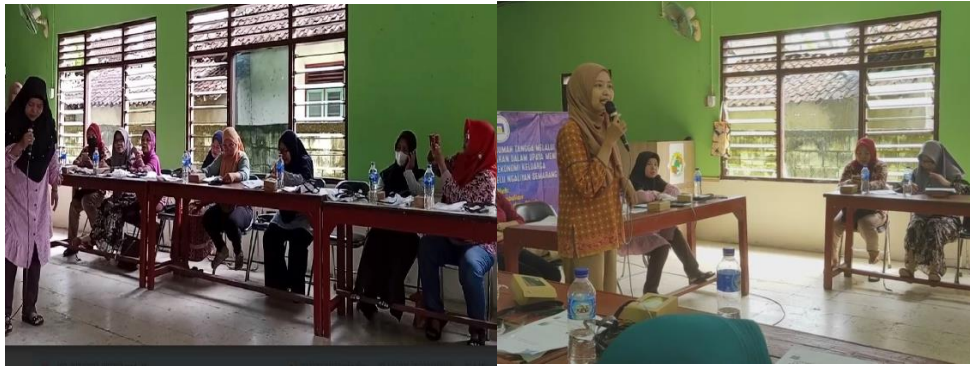
Gambar 2 Pemaparan Materi

Materi yang disampaikan terdiri dari tiga bagian, yaitu bagian pertama tentang pencatatan keuangan, bagian kedua tentang praktek mencatat dan pembukuan sederhana, serta bagian ketiga diskusi dan tanya jawab.